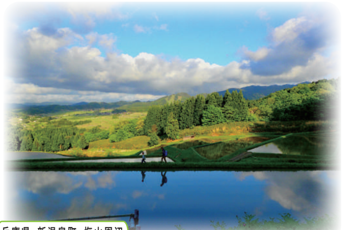
兵庫県 新温泉町 塩山周辺