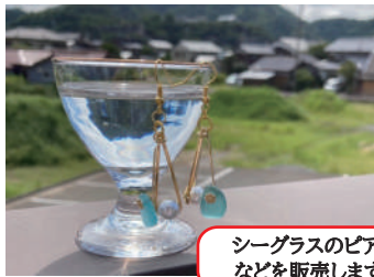
シーグラスのピアス などを販売します。