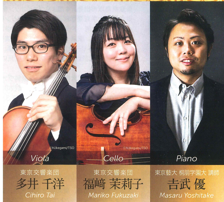
東京交響楽団 多井 千洋 Cihiro Tai