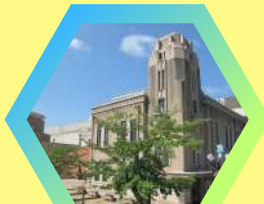
わらべ館 エントランスホール 鳥取市西町3丁目202