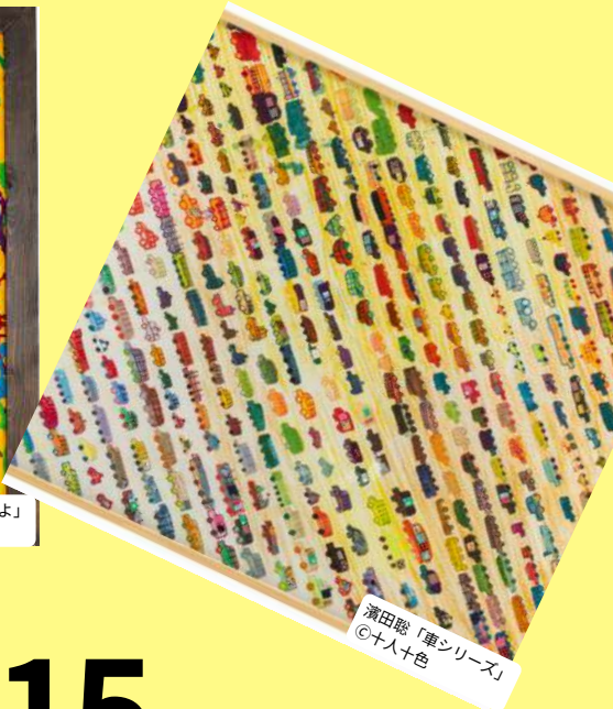
濱田聡「車シリーズ」

2024. 9 月 1 日(日) >> 9 月 15 日(日) 9:00~17:00（最終日15:00まで） 観覧無料