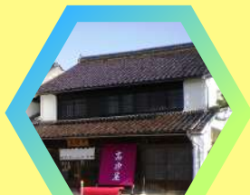
城下町とっとり交流館 高砂屋 家財蔵 鳥取市元大工町1 ※休館日 9/2（月）・9/9（月）