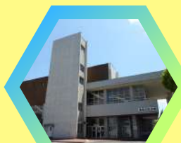
鳥取市民会館 市民サロン 鳥取市掛出町12