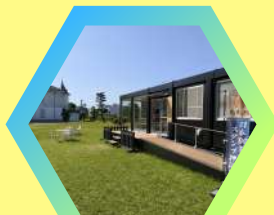
鳥取城跡・仁風閣 展示館 館内 鳥取市東町2丁目121 ※休館日 9/2（月）・9/9（月）