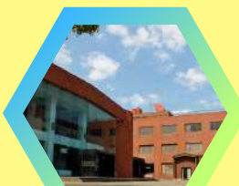
鳥取市文化センター 文団協ひろば（事務所前） 鳥取市吉方温泉3丁目701