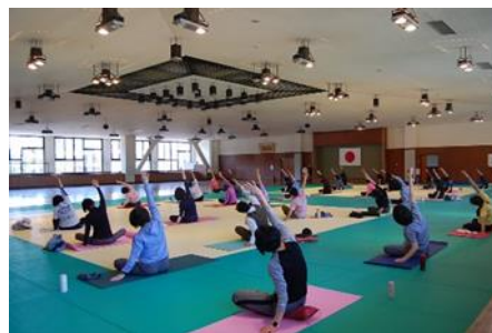
[リラックスヨガ教室]