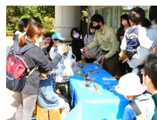
【フィールドワークショップ 「きのこ観察」】