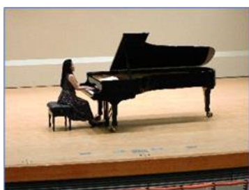
【小山実稚恵ピアノリサイタル】