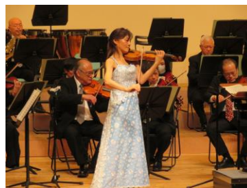
宝くじ文化公演「ミューズの囁き」