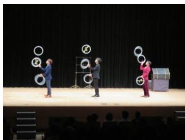
ジャグリング集団「空転軌道」 音と空間のジャグリング