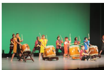
[和太鼓ワークショップ]