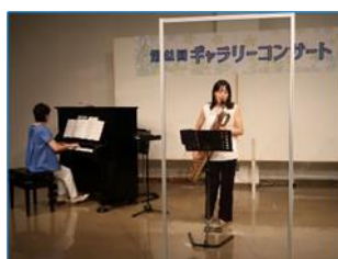
[ギャラリーコンサート]