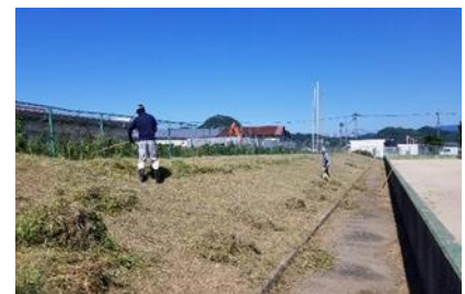
[千代テニス場の除草作業]