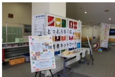
〔鳥取市民会館「因幡和太鼓の祭典」会場にてSDGsの紹介〕

鳥取県肢体不自由児協会に寄付のお礼としていただいた「あいサポート」ロゴマーク入りのバッグを使用し、広報活動の際に役立てている。