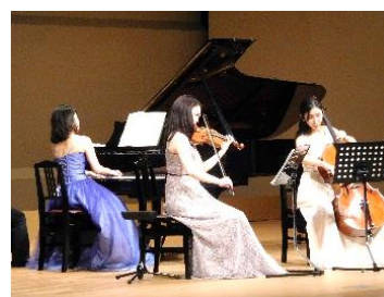
【若手アーティスト支援事業 「Next Generation」】