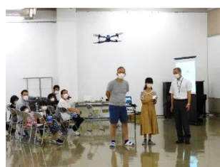
【ドローンの操作を体験しよう】