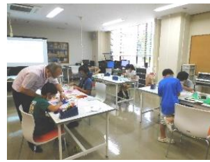
[デジタル工作に挑戦！]