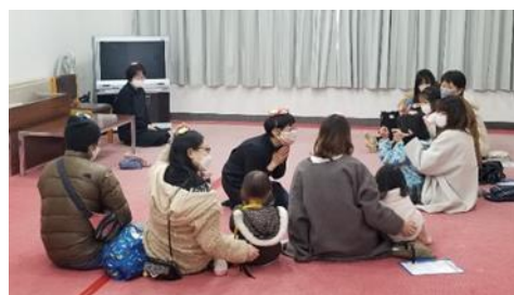
[親子で楽しむ読み聞かせ]